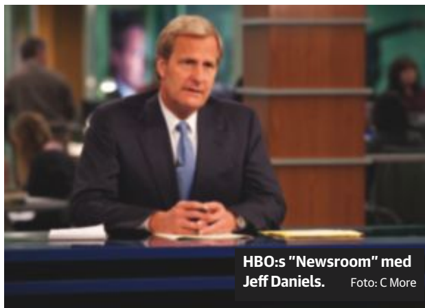
HBO:s "Newsroom" med Jeff Daniels.